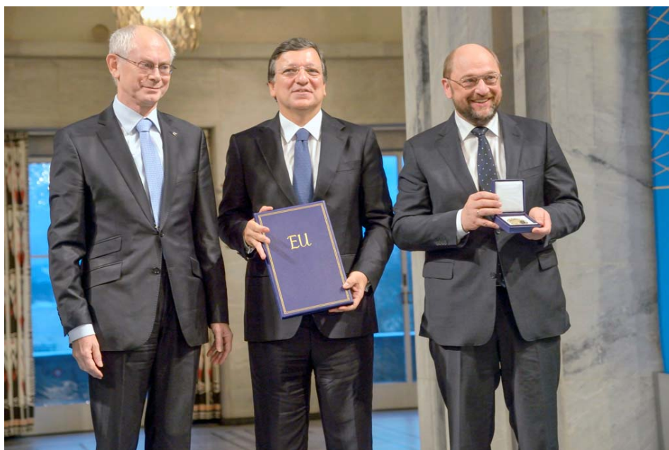
Przewodniczący Rady Europejskiej, Komisji Europejskiej i Parlamentu Europejskiego odebrali Pokojowego Nobla dla UE w Oslo