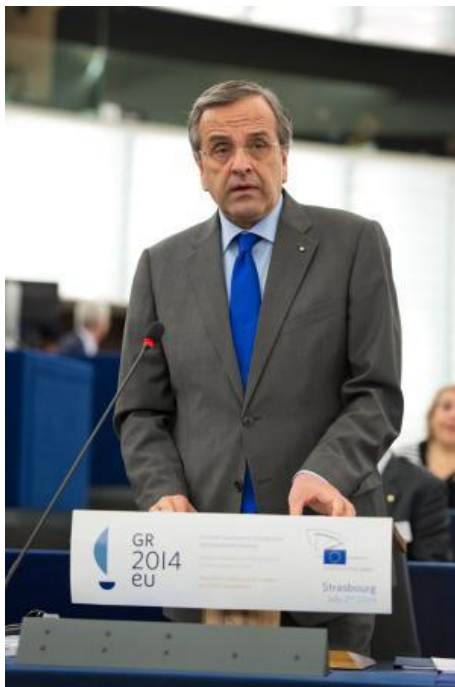
Premier Grecji Antonis Samaras podczas wystąpienia w PE

cała Unia Europejska musiała zmagać się z bardzo poważnymi wyzwaniami w ciągu ostatnich trzech lat, obywatele Wspólnoty wykazali się solidarnością oraz zdolnością dokonywania trudnych zmian.