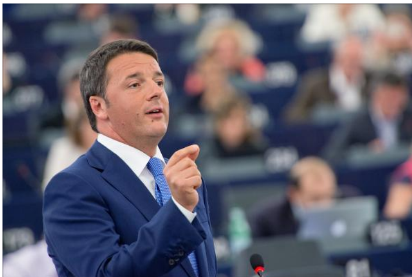
Matteo Renzi przedstawia priorytety włoskiej prezydencji podczas pierwszej lipcowej sesji plenarnej Parlamentu Europejskiego

W pełnym pasji i entuzjazmu przemówieniu, premier Włoch Matteo Renzi w dniu 2 lipca przedstawił na posiedzeniu plenarnym wizję prezydencji włoskiej. Nawoływał do zmian i reform, podkreślił wkład i otwartość Włoch i zalecał wzrost gospodarczy i solidarność. Przemówienie premiera zostało przyjęte entuzjastycznie, choć niektórzy eurodeputowani z EPP, Zielonych i ECR domagali się od premiera konkretnych działań i zaangażowania.