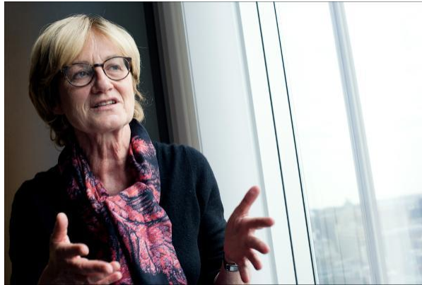
Mady Delvaux (S&D, Luksemburg)

Wszyscy obywatele UE, którzy mieszkają lub tymczasowo przebywają w państwie członkowskim innym niż kraj ojczysty, będą potencjalnie kontaktować się z administracją państwa pobytu, np. służbą zdrowia. By ograniczyć bariery administracyjne, Komisja Prawna (JURI) zaakceptowała w dniu 12 listopada porozumienie z Radą dotyczące uproszczenia procedury przyjmowania określonych dokumentów urzędowych w UE. Posłanka sprawozdawczyni Mady Delvaux (S&D, Luksemburg) wyjaśnia, na czym polegają zmiany.