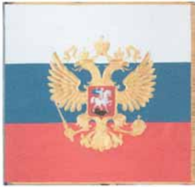
Chorągiew Prezydenta Rosji