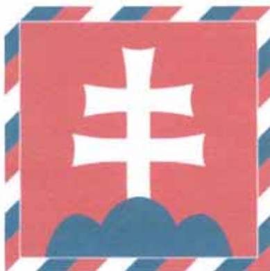
Chorągiew Prezydenta Słowacji