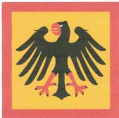
Chorągiew Prezydenta Niemiec