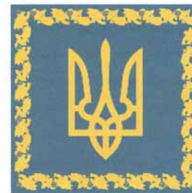
Chorągiew Prezydenta Ukrainy